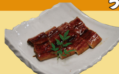
・うなぎ蒲焼(1/2) 1,580円 (税込1,738円)