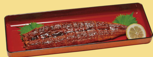
・うなぎ蒲焼(1匹) 2,500円 (税込2,750円)