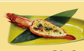
・エビ姿焼 850円 (税込935円)