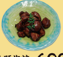
・砂肝塩焼 600円 (税込660円)