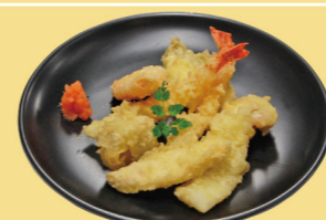
・海鮮天ぷら 1,500円 (税込1,650円)