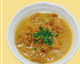
・豚ホルモン 650円 (税込715円)