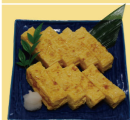
・だし巻玉子 750円 (税込825円)