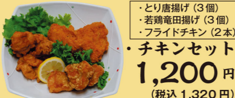
・とり唐揚げ(3個) ・若鶏竜田揚げ(3個) ・フライドチキン(2本) チキンセット 1,200円 (税込1,320円)