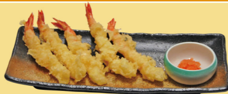
・エビ天ぷら 1,250円 (税込1,375円) (5本)