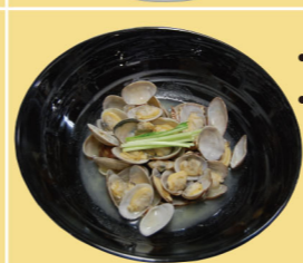
・アサリバター焼 ・アサリ酒蒸し (各) 850円 (各税込935円)