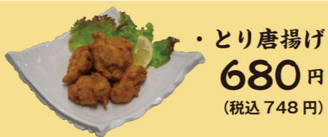
・とり唐揚げ 680円 (税込748円)