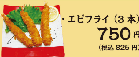
・エビフライ(3本) 750円 (税込825円)