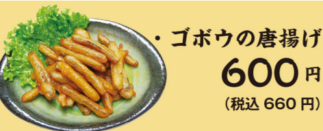
・ゴボウの唐揚げ 600円 (税込660円)