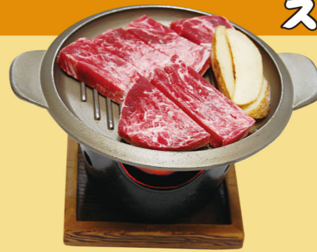
・牛ステーキ焼(150g) 1,500円 (税込1,650円)