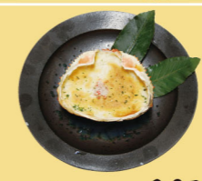
・カニグラタン 650円 (税込715円)