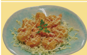
・エビマヨ (野菜入) 1,200円 (税込1,320円)