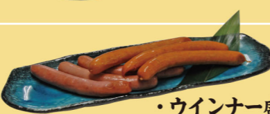
・ウインナー盛合せ (荒挽きウインナー3本、ピリ辛3本) 900円 (税込990円)