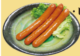
・ピリ辛ウインナー チョリソー 450円 (税込495円)