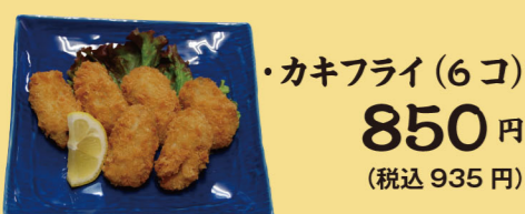
・カキフライ(6コ) 850円 (税込935円)

●メニュー表記内すべての 各料理につきましては、 盛りつけ方または、 器が変わる場合がございます。