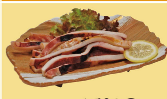
・イカ焼 750円 (税込825円)