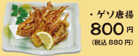
・ゲソ唐揚 800円 (税込880円)