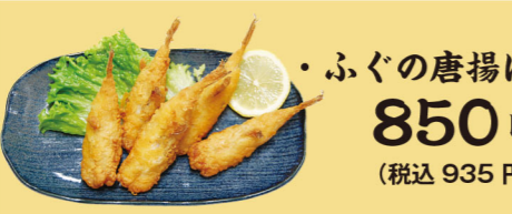
・ふぐの唐揚げ 850円 (税込935円)