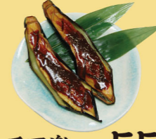
・ナス田楽 550円 (税込605円)