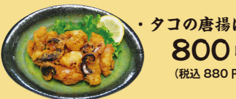
・タコの唐揚げ 800円 (税込880円)