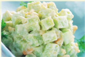
・ダイヤサラダ (ししゃもの卵)