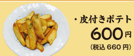
・皮付きポテト 600円 (税込660円)