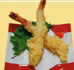
・ジャンボエビ天(2本) 1,400円 (税込1,540円)