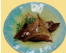
・カンパチ煮 600円 (税込660円)