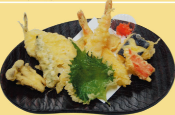
・天ぷら盛り合せ 1,350円 (税込1,485円)