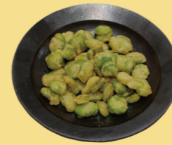
・そら豆塩天ぷら 600円 (税込660円)