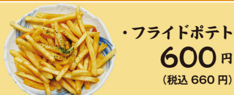
・フライドポテト 600円 (税込660円)