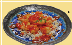
・エビチリソース (野菜入) 1,200円 (税込1,320円)