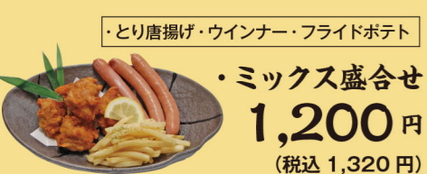
・とり唐揚げ・ウインナー・フライドポテト 1,200円 (税込1,320円)